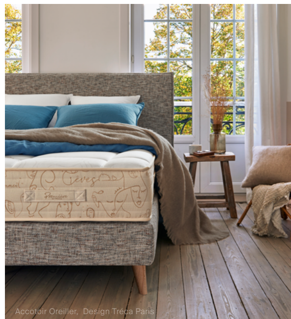
Accotoir Oreiller, Design Tréca Paris

Nous avons imaginé deux propositions d'ensemble :