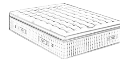
4 - Un matelas + sur-matelas en option (confort, dimension et forme personnalisés)