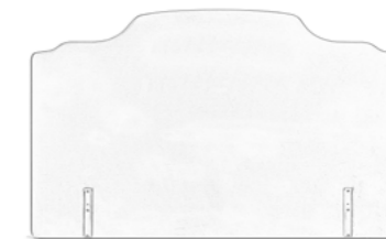
2 - Un accotoir