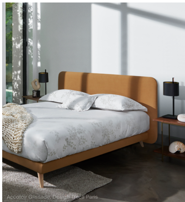
Accotoir Glissade, Design Tréca Paris

Nous avons imaginé trois propositions d'ensemble :