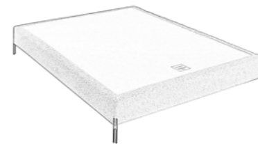
3 - Un sommier et pieds