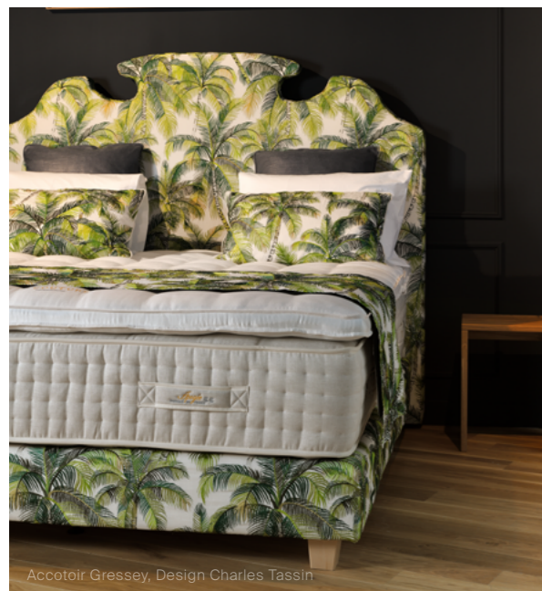
Accotoir Gressey, Design Charles Tassin

Nous avons imaginé trois propositions d'ensemble :