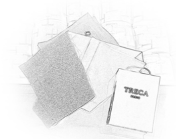
1 - Un tissu Tréca, le vôtre, ou du cuir