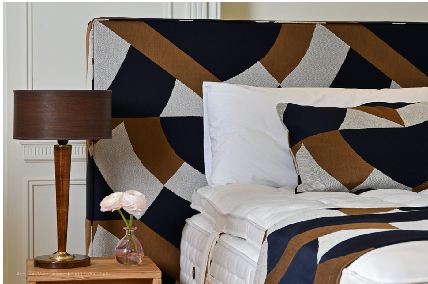
Accotoir Cube wide, Design Tréca Paris